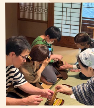
糸魚川バタバタ茶を親子で体験