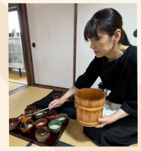
愛知の振茶「いなぶ桶茶」