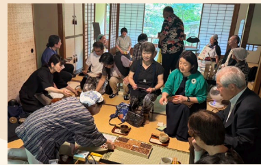
令和7年新潟会場「ふりふり振茶会」の様子

相馬御風は、良寛研究者として世界に良寛の魅力を伝えるとともに、郷土の民俗風習にも関心を寄せ、随筆『野を歩むもの』で『タテ茶(バタバタ茶)』を「一挙四徳の良い風習」と紹介しました。糸魚川バタバタ茶は新潟県に残る唯一の振茶文化です。この素晴らしい文化を広めるため、パネル展で振茶文化を学び、糸魚川バタバタ茶を楽しむイベントを新潟県内2会場で開催します。